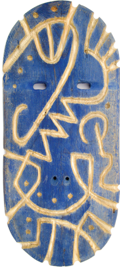
Blue Mask, carved colored pine tree, 52x 23 x 2.5 cm